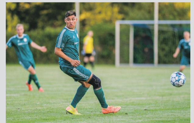
Glostrup FK tabte i weekenden i Albertslund.

Efter nederlaget har Glostrup FK et point efter tre kampe et point efter tre kampe og er lige under nedrykningsstregen.