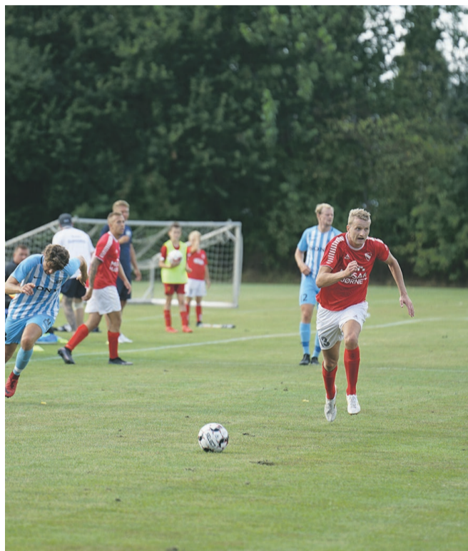
Ejby IF 1968 ville gerne have haft fordel af de hurtige kanter i kampen mod IF Bytoften, men det var banen for kort til.